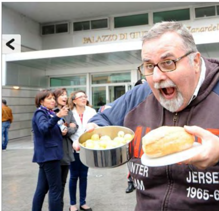
Panino Day, protesta dei dipendenti tribunale per i tagli al personale Brescia 10 ottobre 2016